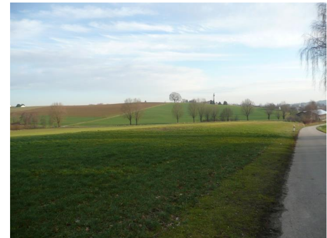
Kurz vor Altomünster