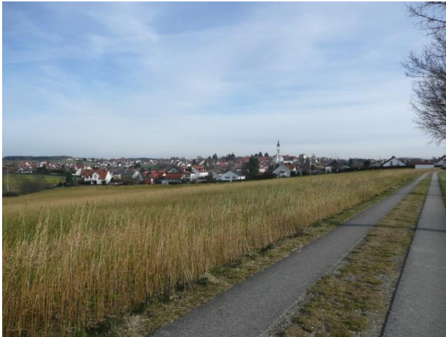
Rückblick auf Altomünster

12.05.2018 Im Priener Hinterland TP 8:30 Uhr M-Hbf. Gleis 11 09.06.2018 Zu den Josefstaler Wasserfällen TP 8:40 Uhr M-Hbf. Gleis 34 21.07.2018 Von Ruhpolding - auf Umwegen - die Traun aufwärts 18.08.2018 Rottau – Hefter Alm