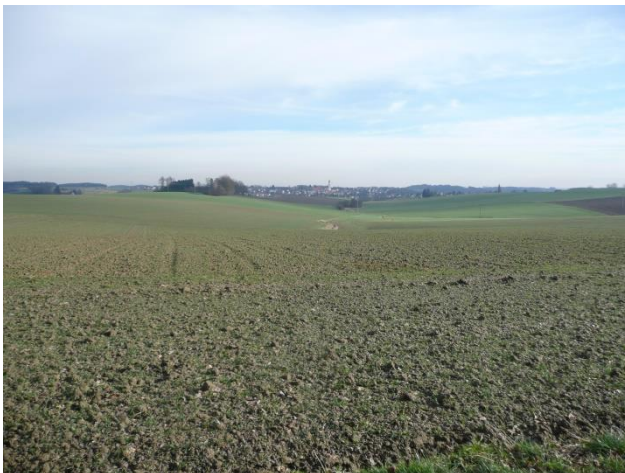
Wieder Blick auf Altomünster